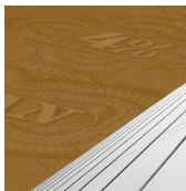
Image de couverture:

Premier plan: Nos locaux à New Court, Londres